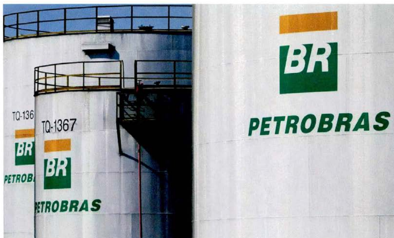
Refinaria da Petrobras em Paulínia (SP)

05/07/2021 13h38 · Atualizado há 2 semanas